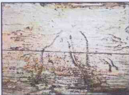
Obr. 3: Požarský lýkožrouta lesního

části, jsou v kůře patrné vietové otvory (průměr otvoru cca 2 mm). Na patě kmene nebo za šupinami kůry pak zůstávají rezavohnědé drtinky, které kůrovci vyhazují z hlodaných chodbiček. Strom vzápětí po napadení kůrovci hyne, přesto koruna zůstává ještě určitou dobu zelená. Tyto stromy mohou upoutat pozornost a je proto potřeba v okolí nalezených stromů důkladně prohlédnout i stromy okolní. Napadené stromy doporučujeme pro lepší orientaci nejprve vyznačit (barvou, páskou nebo třeba sekyrkou) a pak teprve pokácet a provést asanaci.