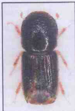
Obr. 1: Lýkožrout smrkový

Nejprve je třeba ověřit, jestli se skutečně jedná o lýkožrouta smrkového nebo lýkožrouta lesklého.