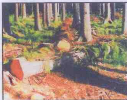
Obr. 4: Pokácený zdravý strom přikrytý větvemi slouží jako lapák

Lapák je pokácený zdravý strom, který se odvětví a větvemi přikryje (viz obr. 4).