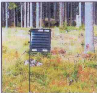
Obr. 5: Lapač

centrace převyšší 1 závrt/dm 2 , snižuje se účinnost a proto se musí kácet další. Důležitá je ale kontrola vývoje kůrovců - lapák je nezahubí, ale pouze odchyťává. Proto pokud larvální chodby dosáhnou délky nad 3 cm, je potřeba zajistit asanaci - lapáky odvézt z lesa nebo odkornit. Na asanaci je potřeba myslet předem a pokud je riziko, že se nepodaří včas, je lepší zvolit druhou metodu - lapač.